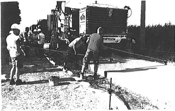
Pilootproject De Circulaire Weg: de stenen en het zand van een afgebroken betonbaan zijn gerecycleerd en omgevormd tot grondstoffen voor de aanleg van een nieuwe betonbaan, die de oude verving.

Noordmoerstraat in Veurne als een fietspad in Diksmuide aangelegd met beton dat uit meer dan 50% recyclagegranulaten bestond. In het Standaardbestek 250 voor de Wegenbouw is het gebruik van hoogwaardig gerecycleerd betongranulaat tot 20% intussen toegelaten. In juli 2018 mocht Wegenbouw De Brabandere dan ook als een van de eerste in Vlaanderen het BENOR-attest